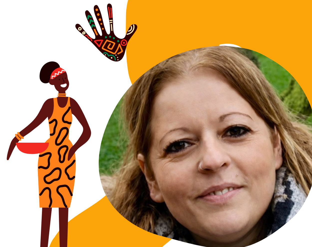
Merci à nos bénévoles

Portée par ses valeurs de partage, de transmission et d'inclusion, l'association poursuit son engagement avec ambition, déterminée à continuer de créer des ponts entre les cultures et à inspirer les jeunes générations.